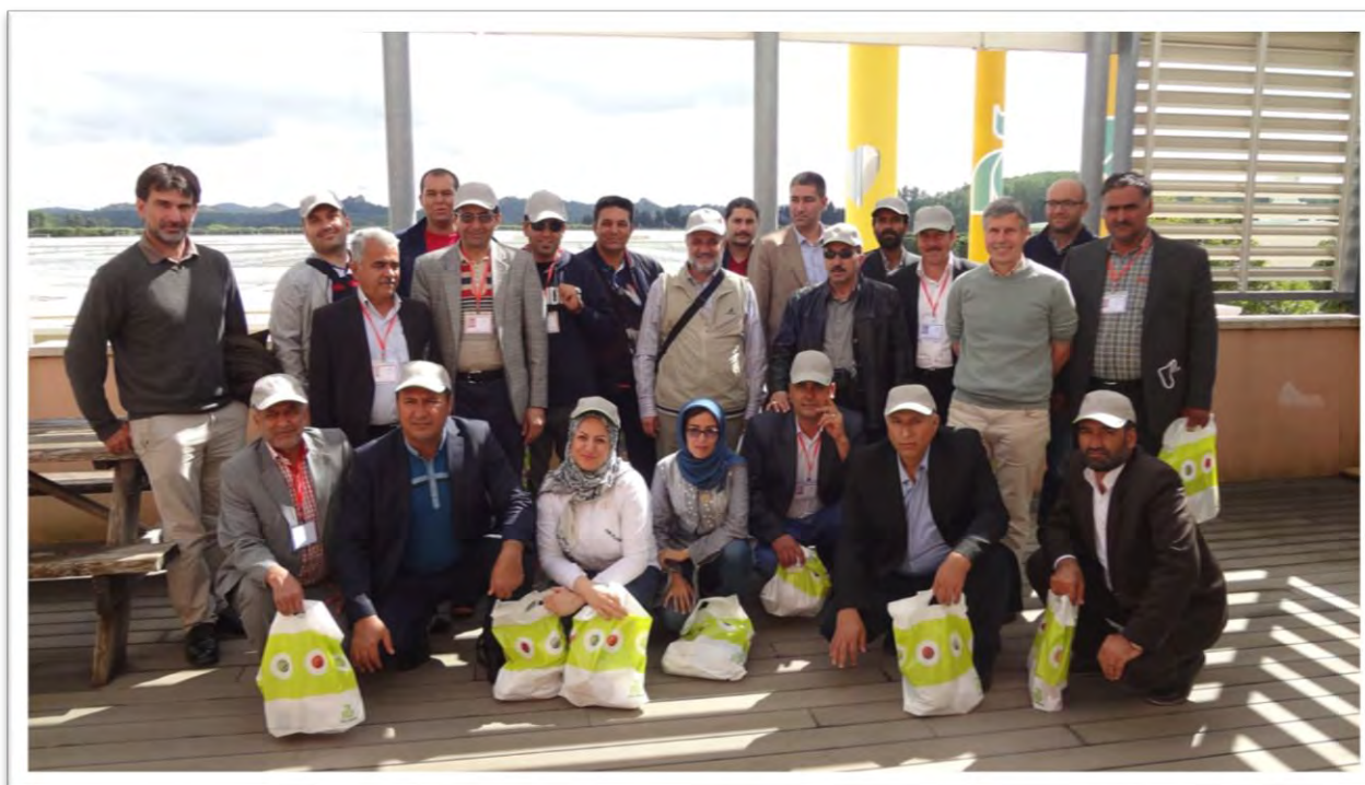
ارائه معرفی اولیه شرکت، تاریخچه و عملکرد آن در حوزه تولید بذر، توسط یکی از مدیران