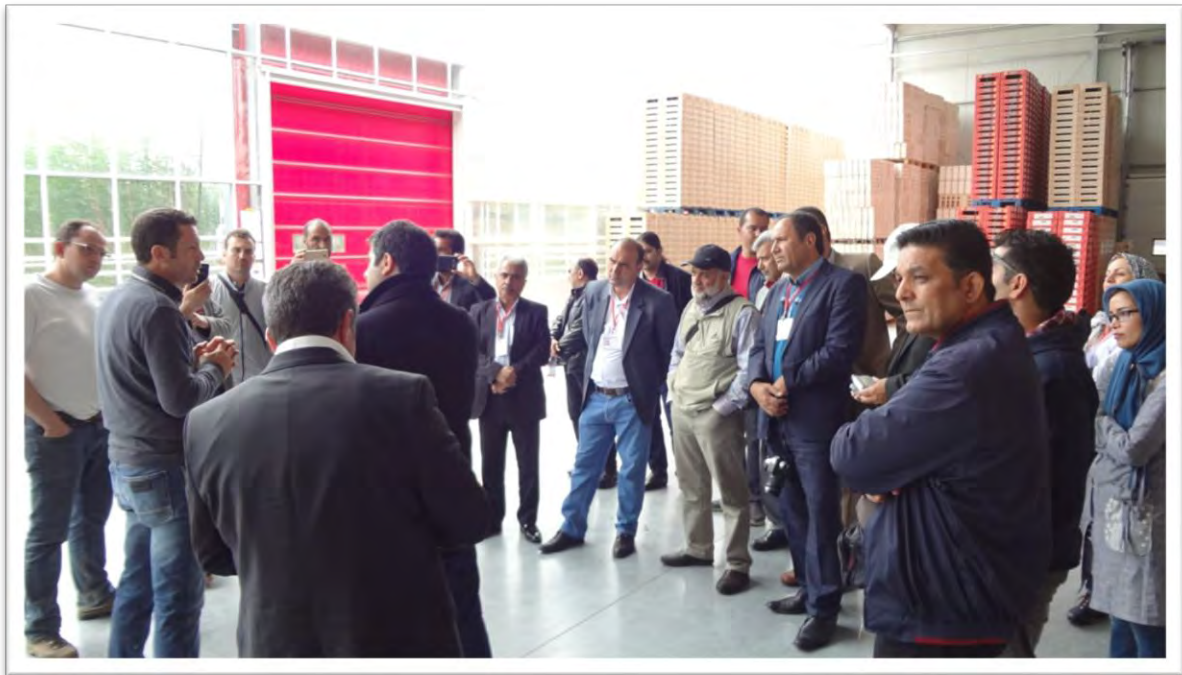
ارائه توضیحات میدانی در خصوص برند روژلین و عملکرد این برند در جنوب فرانسه توسط مدیر فنی و توسعه شرکت