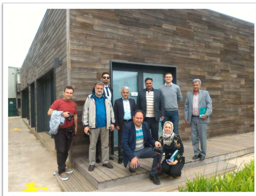
ارائه توضیحات میدانی و بازدید از گلخانه پرورش گوجه واقع در محل شرکت Bio grow