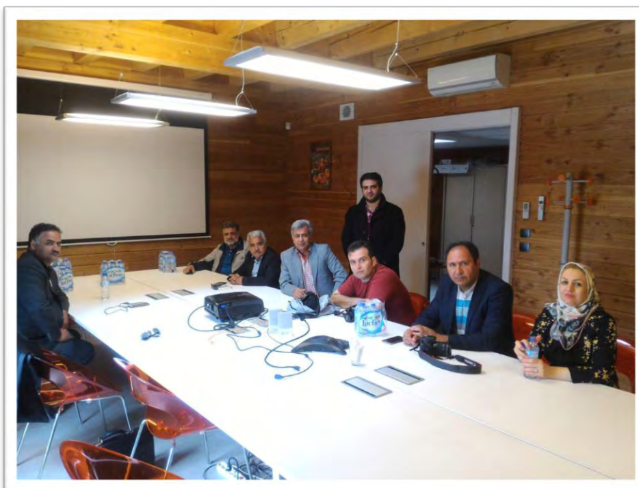
معرفی شرکت Bio Grow و محصولات آن به همراه آموزش کامل نحوه تولید بسترهای کوکوپیتی