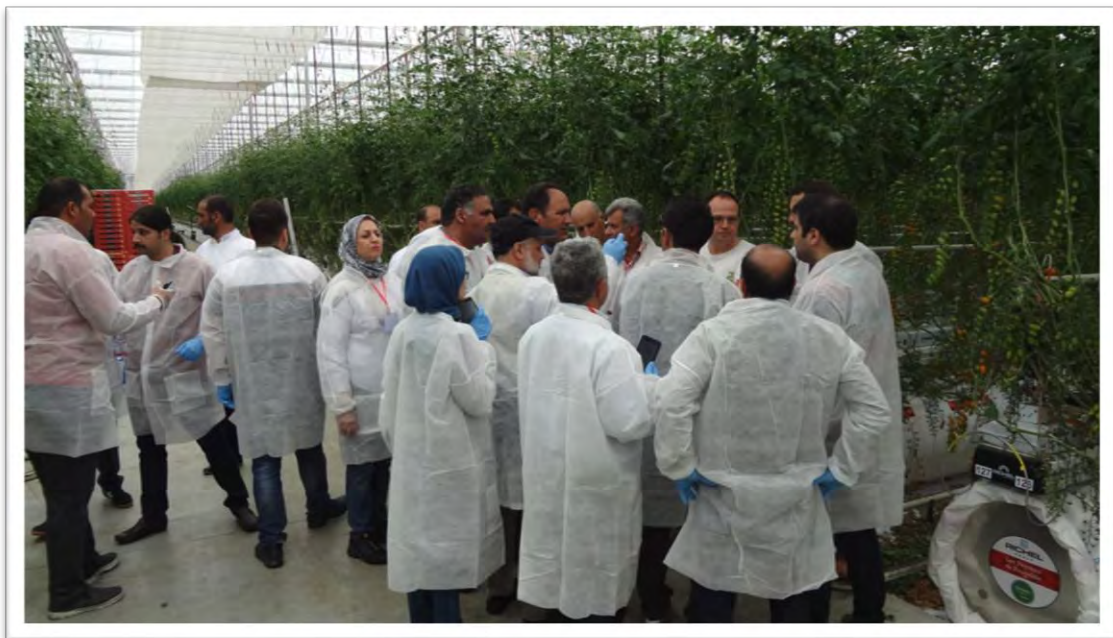
برگزاری جلسه پرسش و پاسخ در گلخانه نیمه بسته شیشه‌ای و ارائه توضیحات مربوطه توسط مالک گلخانه