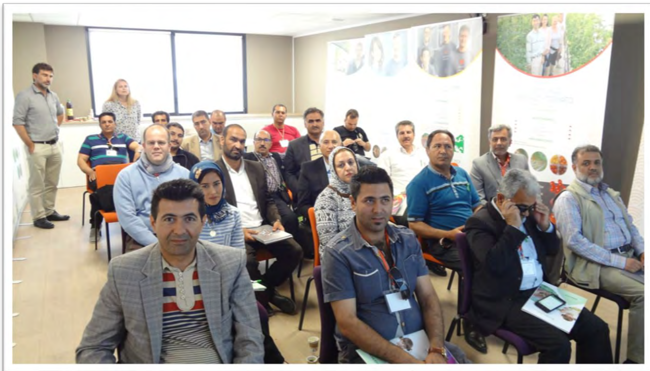
معرفی شرکت تولید بذر ساکاتا، واحدهای آن و عملکرد واحد اروپایی به همراه برگزاری جلسه پرسش و پاسخ