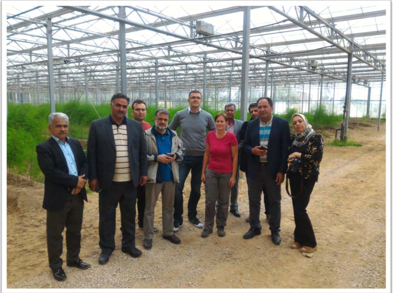
ارائه توضیحات میدانی و بازدید از گلخانه پرورش مارچوبه با سقف پوشیده شده از سلول‌های خورشیدی