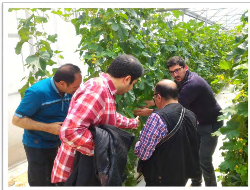
ارائه توضیحات میدانی در خصوص گلخانه‌های شرکت به همراه بازدید از آن‌ها و برگزاری جلسات پرسش و پاسخ