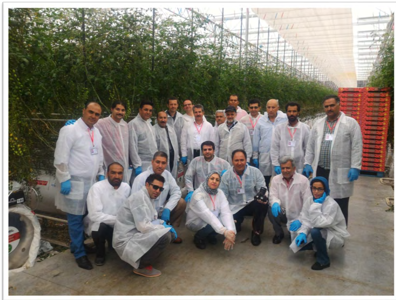
بازدید از گلخانه نیمه بسته شیشه‌ای، محصول: انواع گوجه