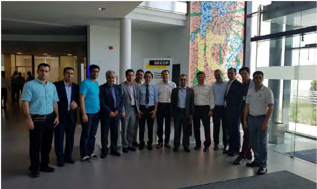
بازدید از شرکت سکاچ در شهر فرستند کشور اتریش