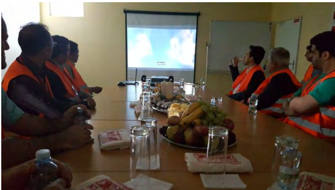
معرفی گروه دنفوس و شرکت دنفوس اسلواکی به همراه فیلم معرفی شرکت