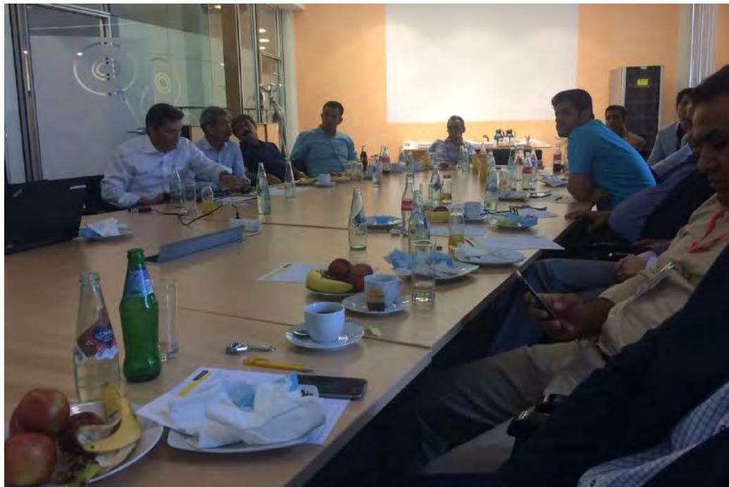
معرفی شرکت سکاپ در کشور اتریش، خط مشی آتی شرکت و جلسه پرسش و پاسخ