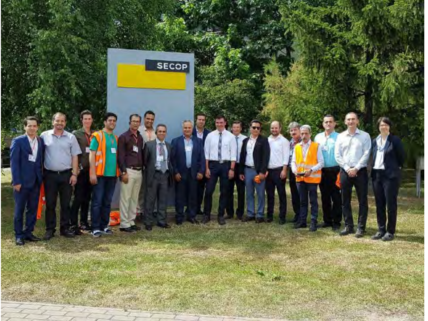
بازدید از شرکت سکا، تولید کننده کمپرسور و کندانسور، شهر زاته موراته کشور اسلواکی