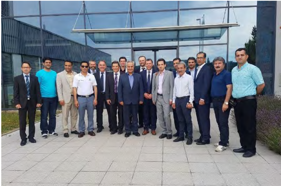
بازدید از شرکت سکاپ در شهر فرستنفد کشور اتریش