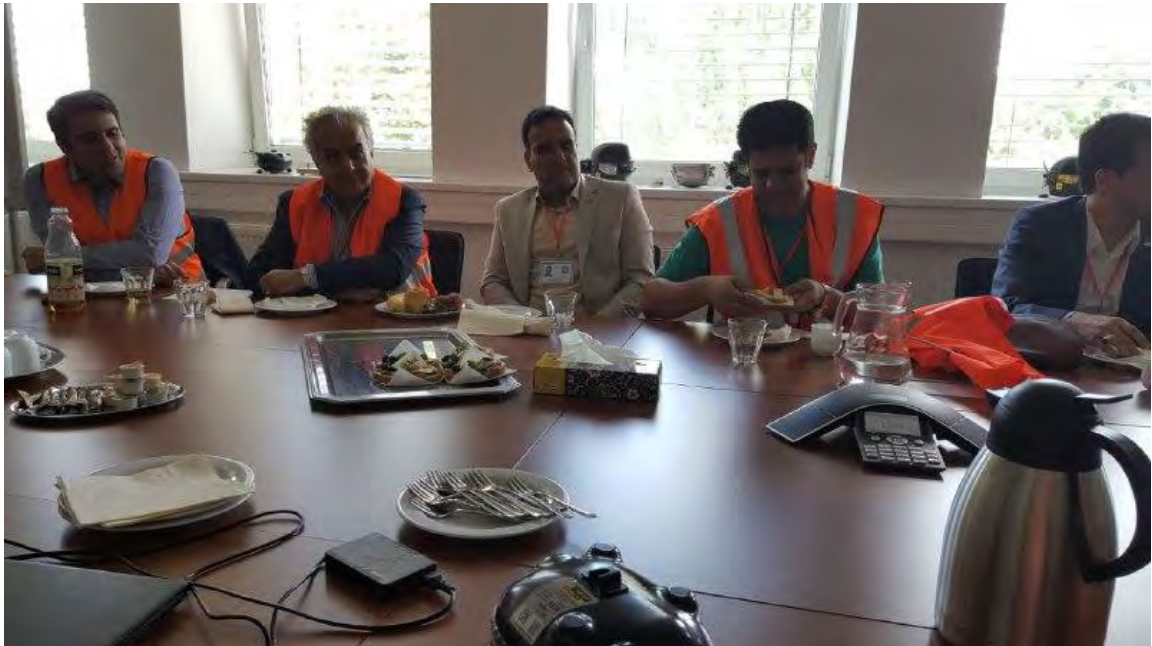
معرفی شرکت سکاچ و واحد این شرکت در اسلواکی به همراه پذیرایی از مهمانان