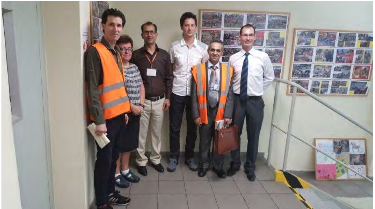
بازدید از محل و تولیدات شرکت ترموستات دنفوس