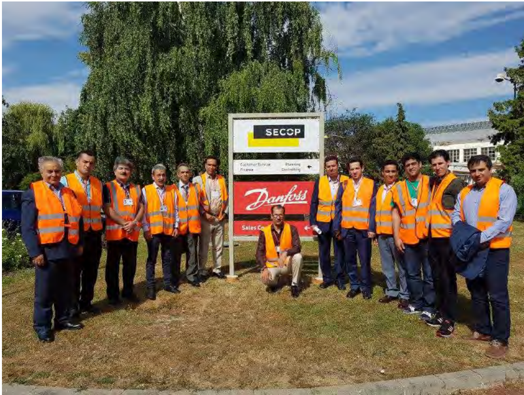
بازدید از شرکت Danfoss Thermostat تولید کننده ترموستات، شهر زاته موراته کشور اسلواکی