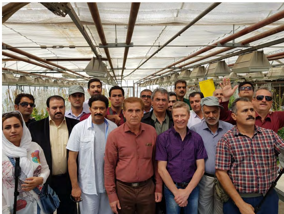
بازدید از گلخانه پرورش بذر کلزا و ارائه توضیحات میدانی در این زمینه