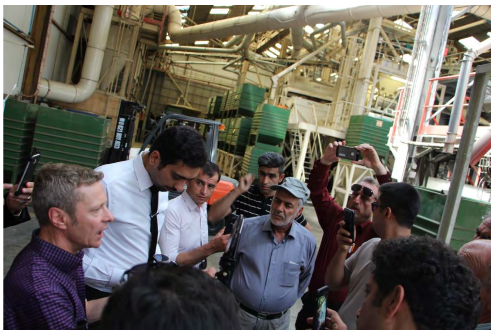
بازدید میدانی از کارخانه، تجهیزات و ماشین آلات مرتبط با فرآوری بذر و بسته بندی در شرکت