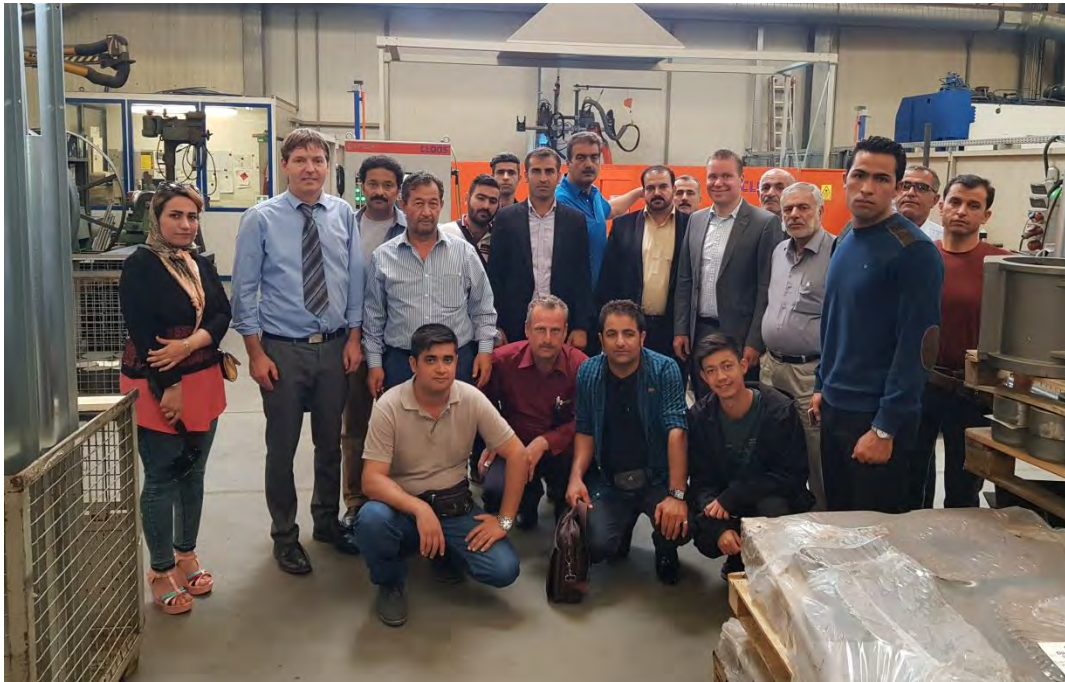
بازدید از ماشین آلات و تجهیزات ساخت قطعات و ابزار شرکت، انبار، محل رنگ کردن، ربات‌های جوشکاری و تجهیزات برش و غیره