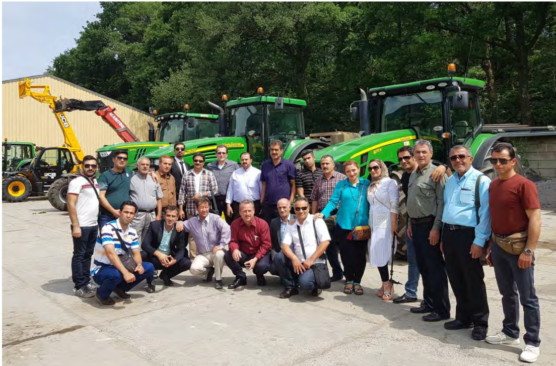
ارائه توضیحات میدانی راجع به ماشین‌آلات شرکت و بازدید از ماشین‌آلات کشاورزی بزرگتر در فضای باز به همراه پرسش و پاسخ راجع به آن‌ها