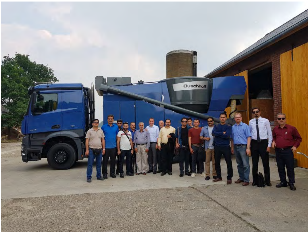
بازدید میدانی از مزرعه و ماشین آلات سیار آسیاب و مخلوط کردن گندم برای تولید خوراک دام و مشاهده عملکرد