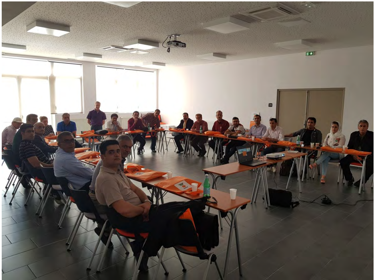
ارائه معرفی اولیه شرکت، تاریخچه و عملکرد آن در حوزه تولید بذر، پرورش، فرآوری و فروش آن‌ها