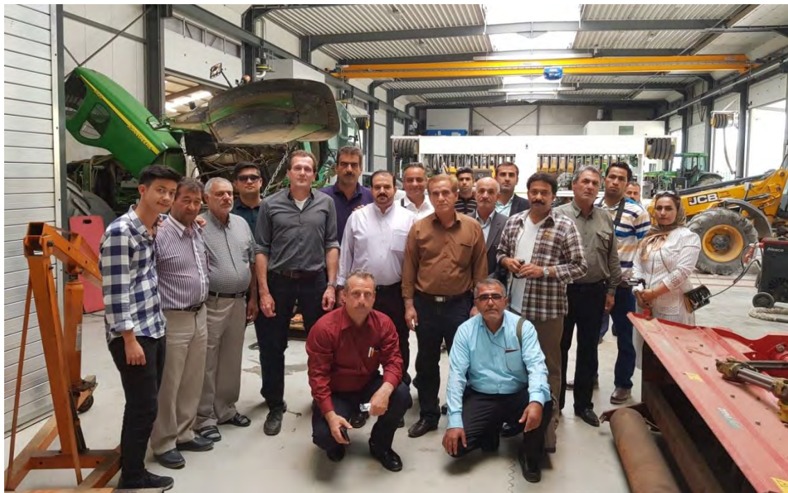
بازدید از کارگاه‌های شرکت و تجهیزات مربوطه جهت انجام تعمیرات و تغییرات متناسب با نیاز مشتری