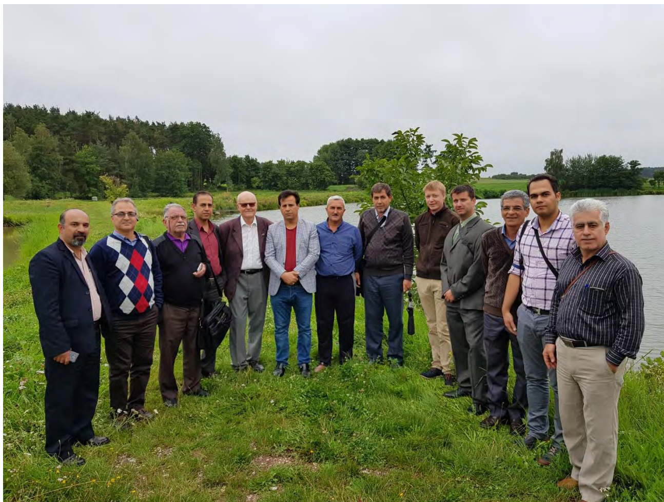
بازدید میدانی از حوضچه‌های پرورش ماهی دکتر Proske از همکاران قدیمی مجموعه و برگزاری جلسه پرسش و پاسخ