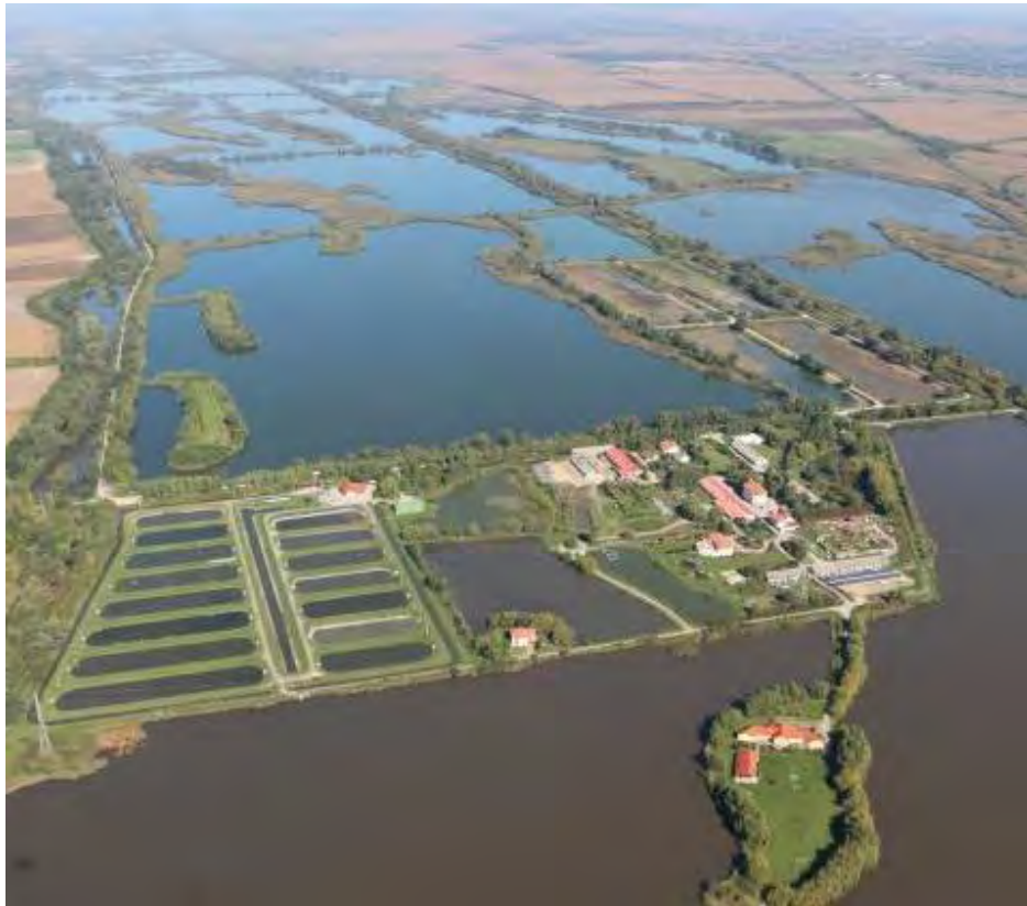
بازدید میدانی از حوضچه‌های پرورش ماهی، مرکز تخم‌ریزی ماهی‌ها، تجهیزات مربوطه و کلوب ماهیگیری شرکت آرانی پوتی

پژواک پژوهش ایده کاوش (سهامی خاص) Research & Innovation Co.