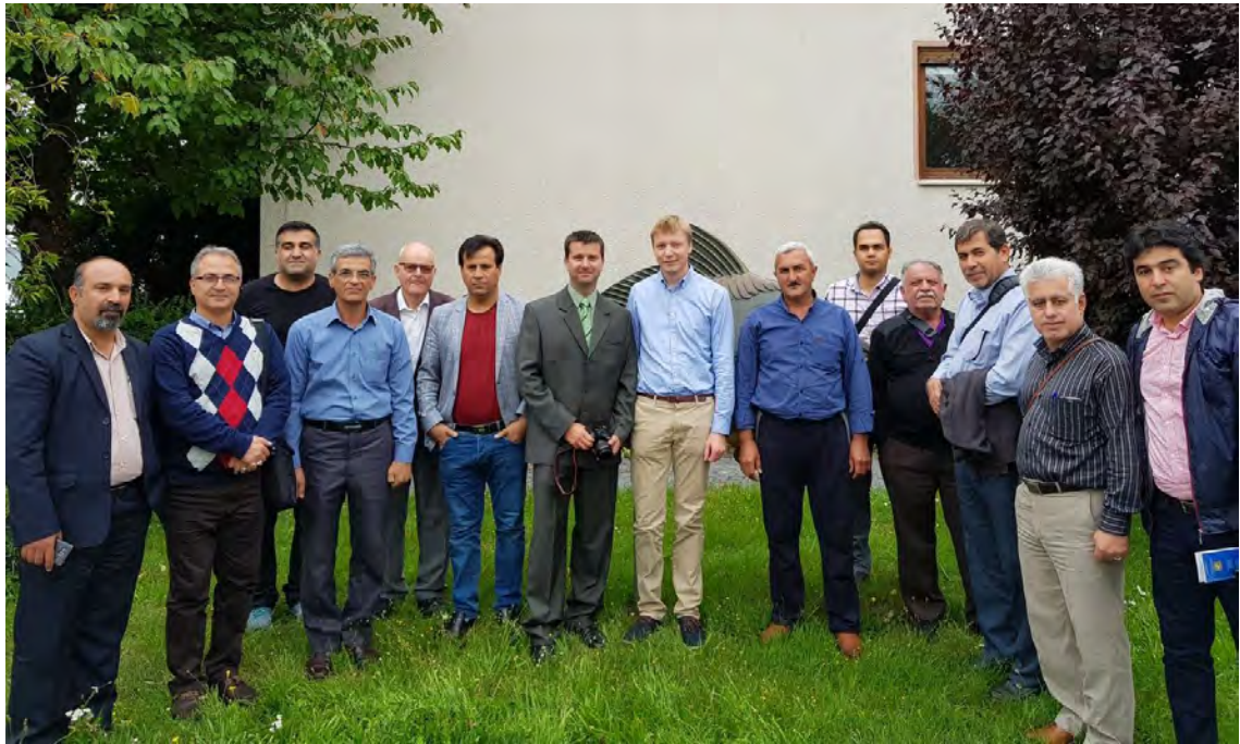
ارائه معرفی اولیه مجموعه LfL و بخش مرتبط با پرورش ماهی آن Institute for Fishery