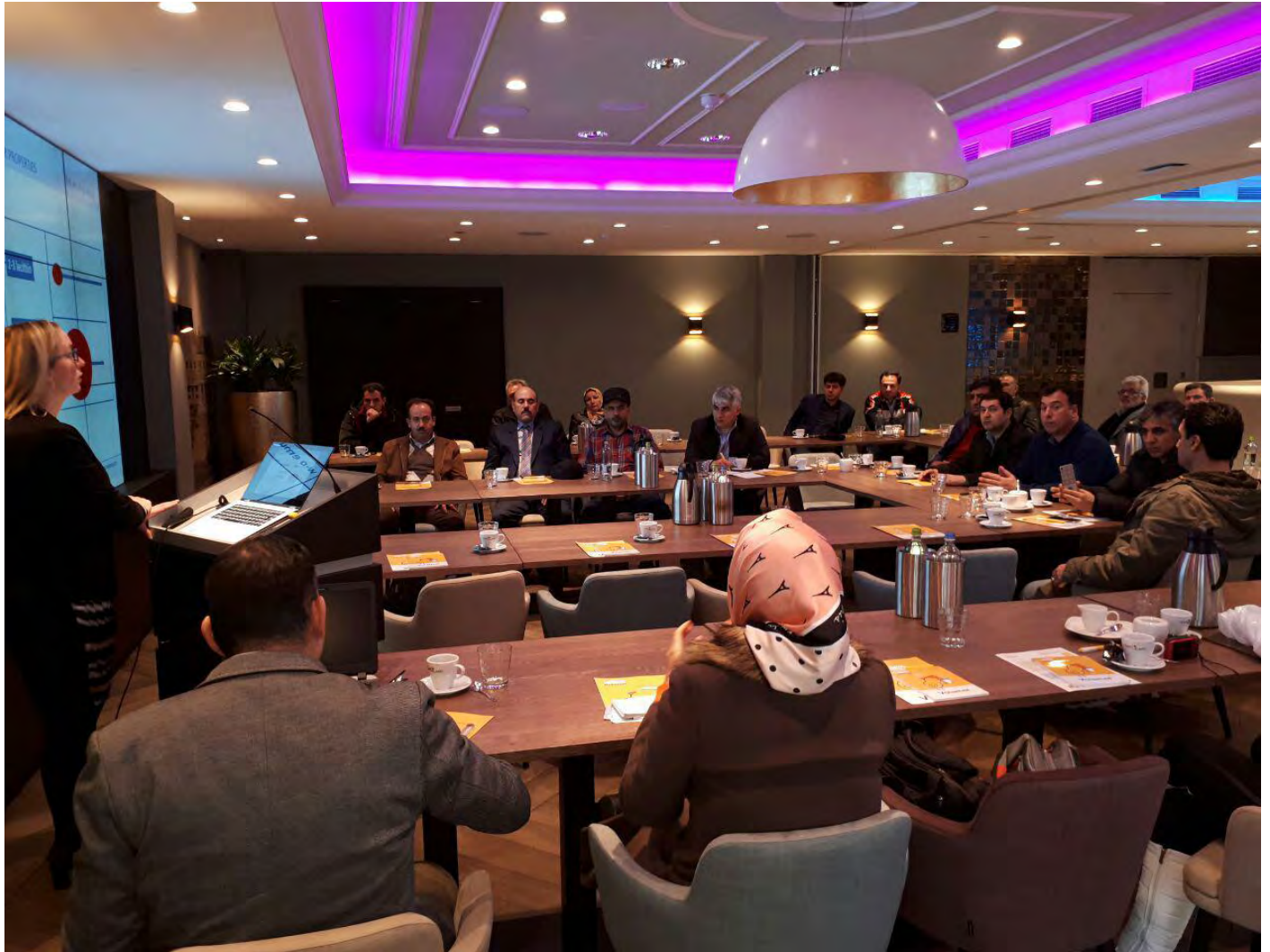
جلسه ارائه و پرسش و پاسخ شرکت Nukamel شهر ویرت، هلند - پنجشنبه ۹۵/۱۱/۲۸