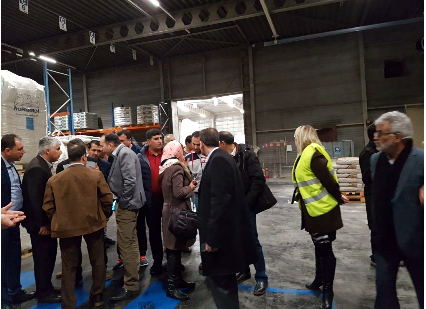
بازدید از خط تولید امولسیفایر شرکت Nukamel شهر ویرت، هلند - پنجشنبه ۹۵/۱۱/۲۸