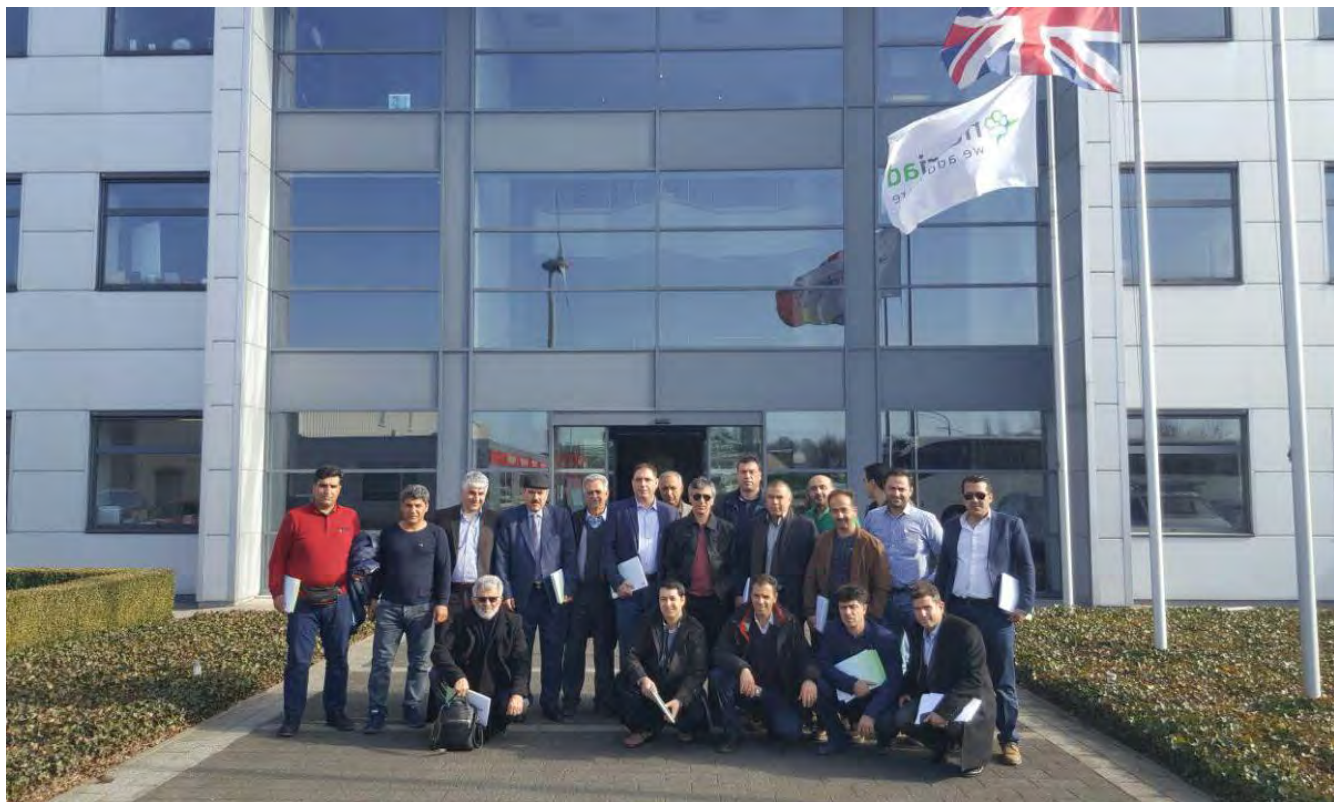
بازدید از کارخانه تولید خوراک INVE België شهر دندرموند، بلژیک - چهارشنبه ۹۵/۱۱/۲۷

پژواک پژوهشی ایده کاوش (سهامی خاص) Research & Innovation Co.