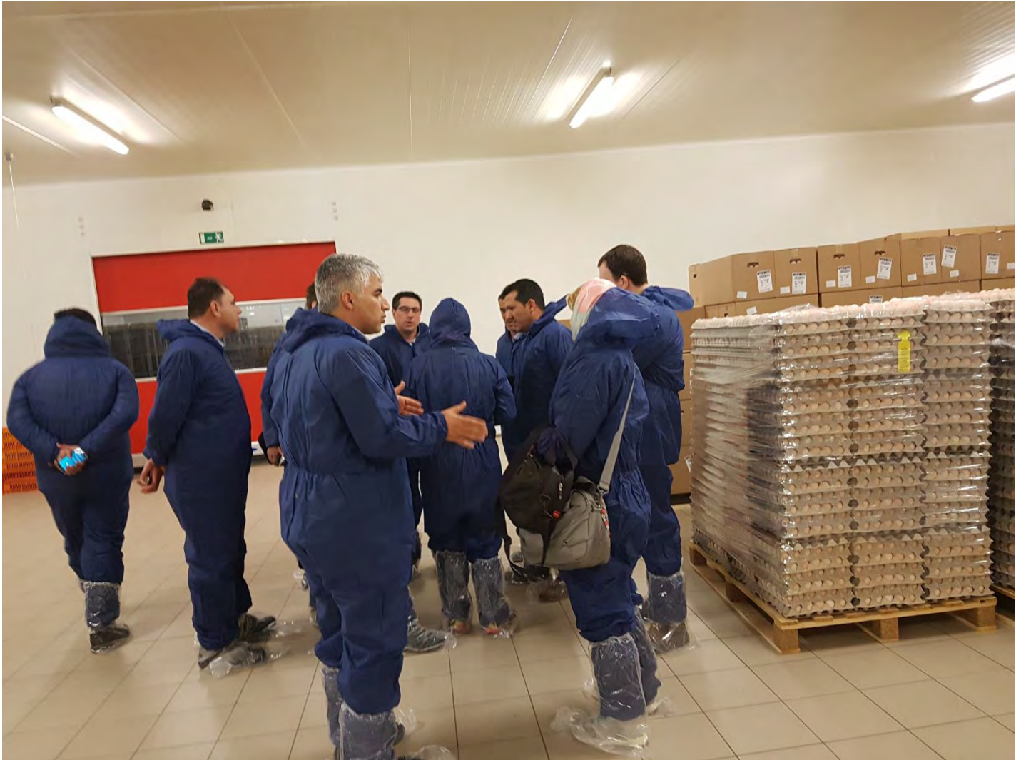
بازدید از هجری شرکت Belgabroed شهر مرکسپلاس، بلژیک - چهارشنبه ۹۵/۱۱/۲۷