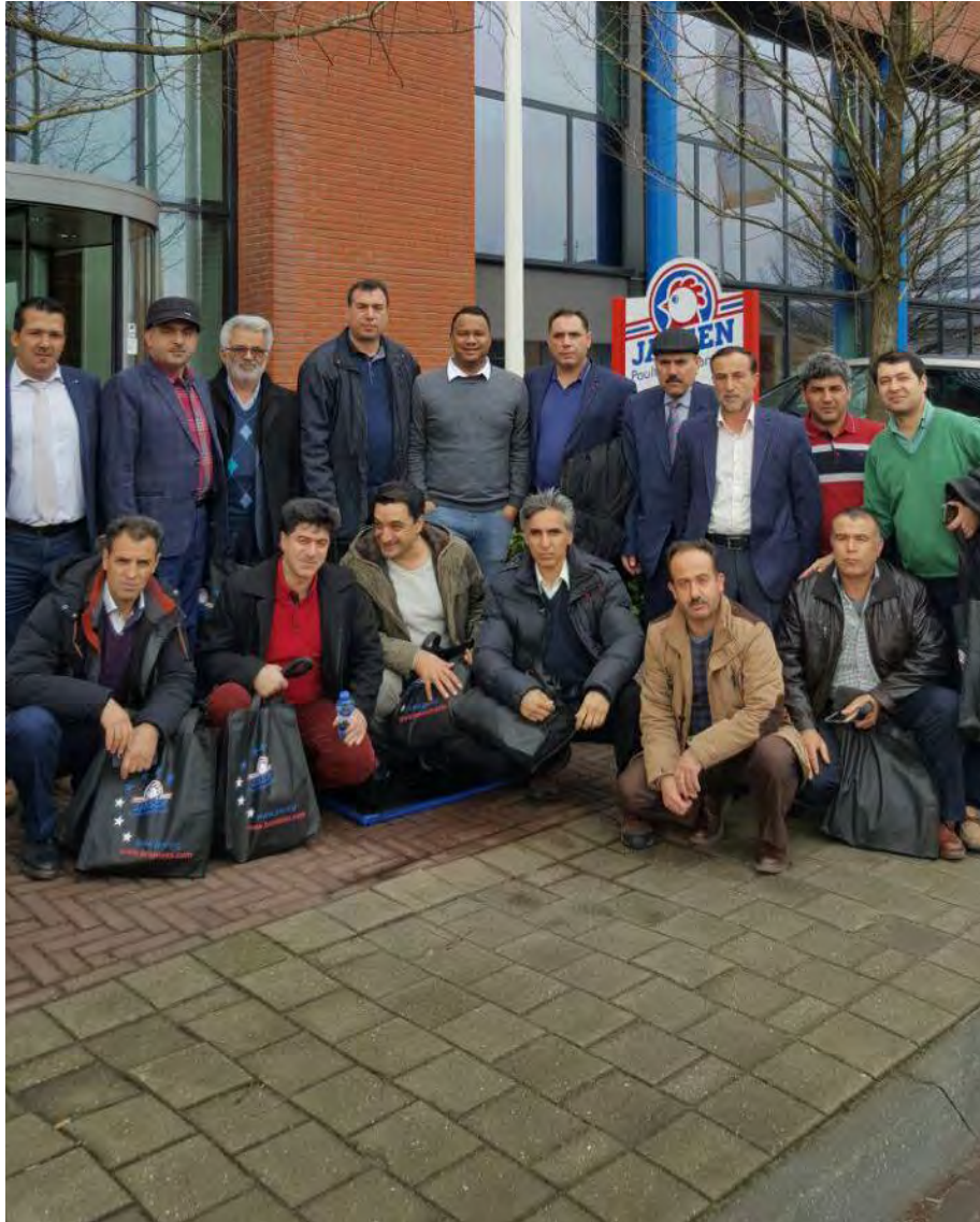
بازدید از شرکت تولید تجهیزات شرکت Jonsen poultry equipment شهر بارنه فلد، هلند - جمعه ۹۵/۱۱/۳۰