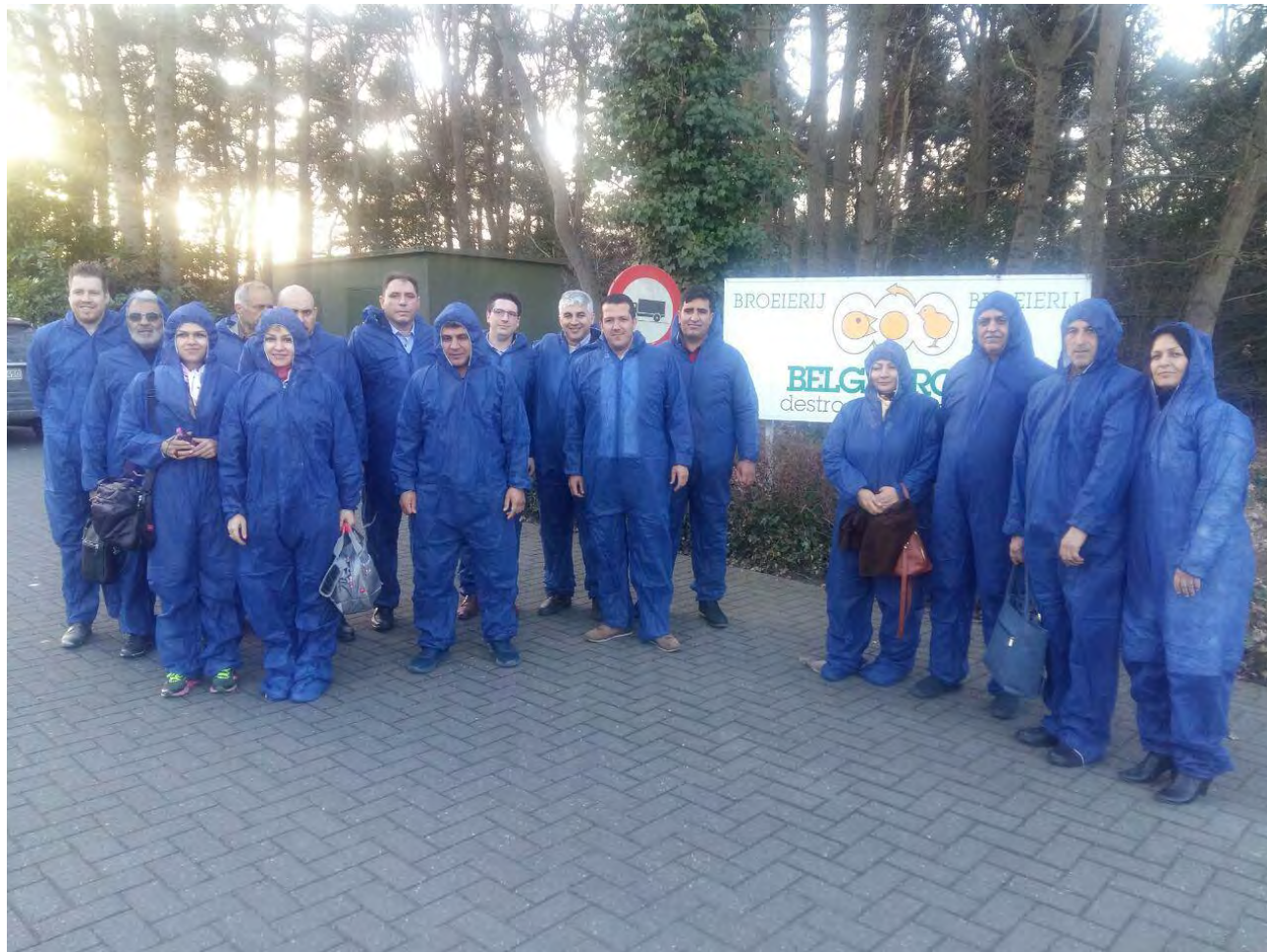
بازدید از هجری شرکت Belgabroed شهر مرکسپلاس، بلژیک - چهارشنبه ۹۵/۱۱/۲۷