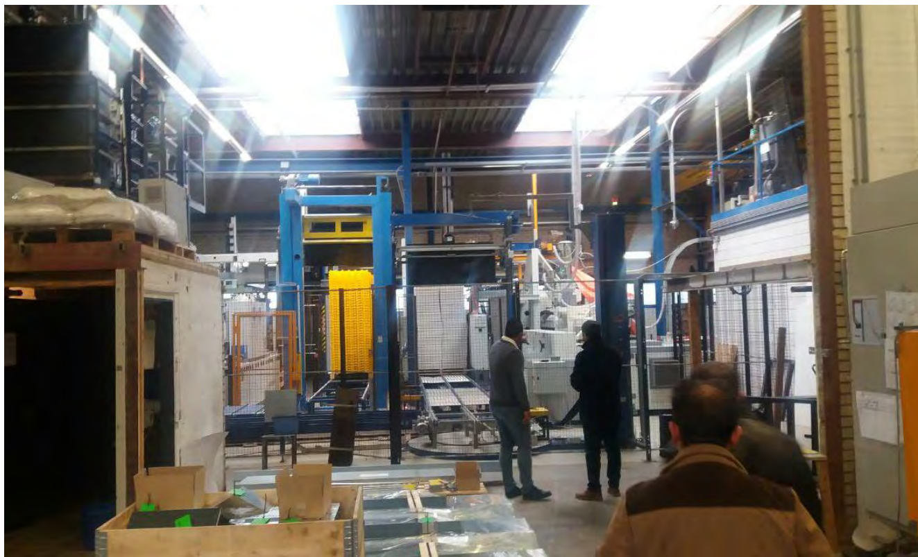
بازدید از سایت تولید تجهیزات شرکت Jonsen poultry equipment شهر بارنه فلد، هلند - جمعه ۹۵/۱۱/۳۰

پژواک پژوهشی ایده کاوش (سهامی خاص) PEZHVAC Research & Innovation Co.