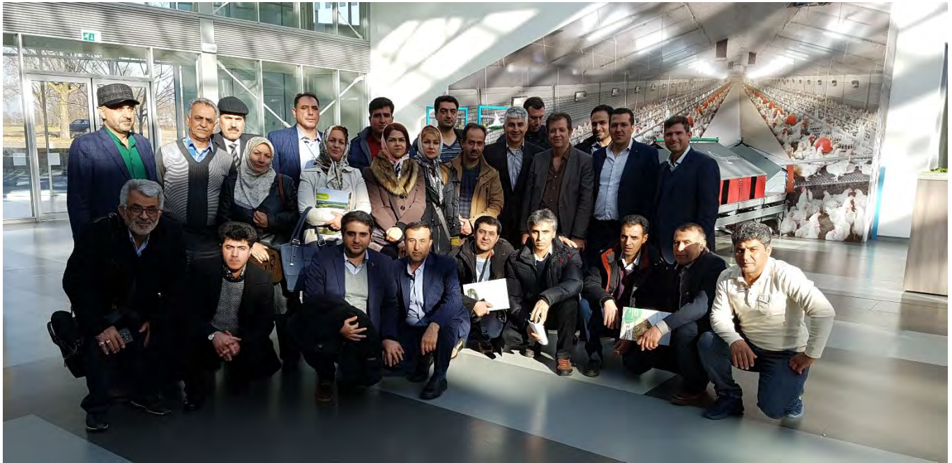
بازدید از شرکت Vencomaticgroup شهر ایرسل، هلند - سه شنبه ۹۵/۱۱/۲۶

پژواک پژوهشی ایده کاوش (سهامی خاص) Research & Innovation Co.