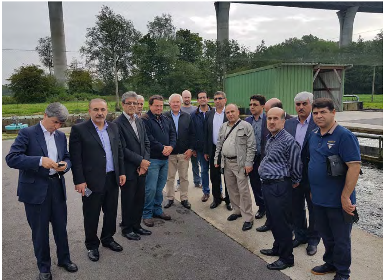
بازدید میدانی از محل پرورش و نگهداری ماهی‌ها به همراه ارائه توضیحات مربوطه