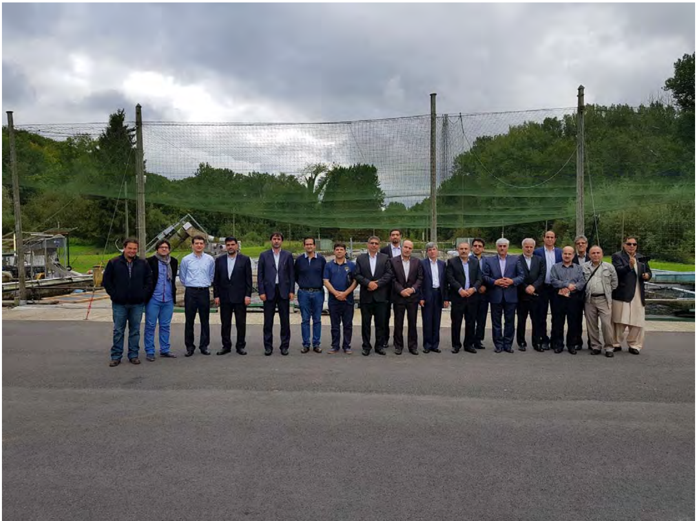
بازدید از مزرعه فوق مدرن با سیستم مدار بسته گردش آب به همراه ارائه توضیحات مربوطه