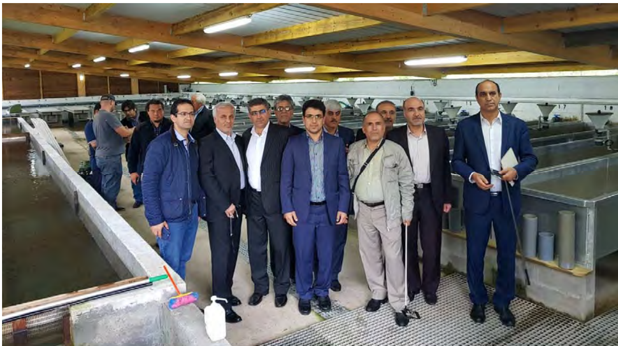
بازدید میدانی از تجهیزات و محل تخم‌گذاری ماهی‌ها در شرکت به همراه پرسش و پاسخ