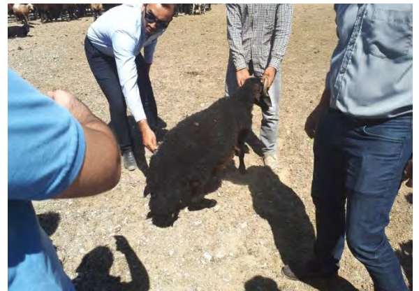
بازدید از واحد های نگهداری گوسفند شرکت کشت و کار احسان ری