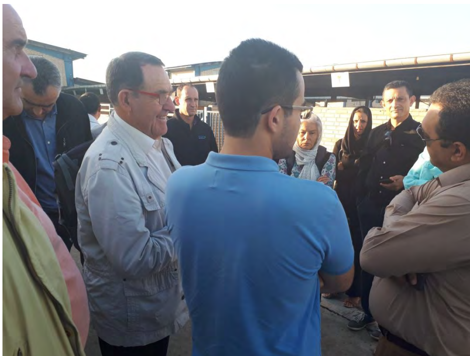
بازدید میدانی از محل نگهداری دام های وارد شده به کشتارگاه و نحوه نگهداری در قرنطینه های مختلف