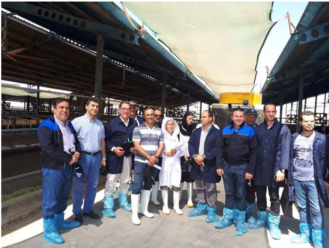
بازدید از مزرعه پرورش گاو شیری شرکت کشت و دام نامفر و جلسه پرس و پاسخ