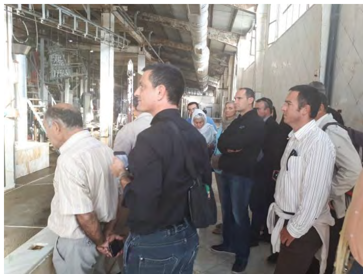
بازدید از مراحل مختلف کشتار دام (گاو و گوسفند) کشتارگاه شرکت بسیم گوشت