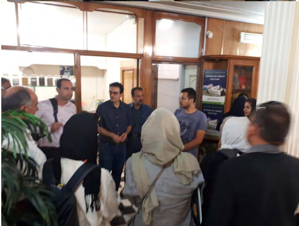
جلسه معرفی فعالیت های تعاونی کشاورزان و دامپروران صنعتی وحدت اصفهان