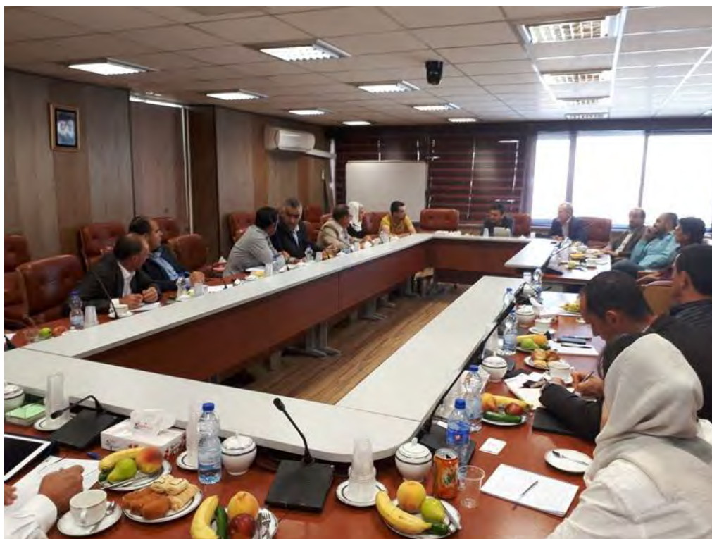
جلسه کارشناسی با مدیر عامل شرکت نهاده های دامی جاهد در حوزه واردات و صادرات دام زنده و بررسی نژادهای گاو شیری و گوشتی در کشورهای ایران و فرانسه