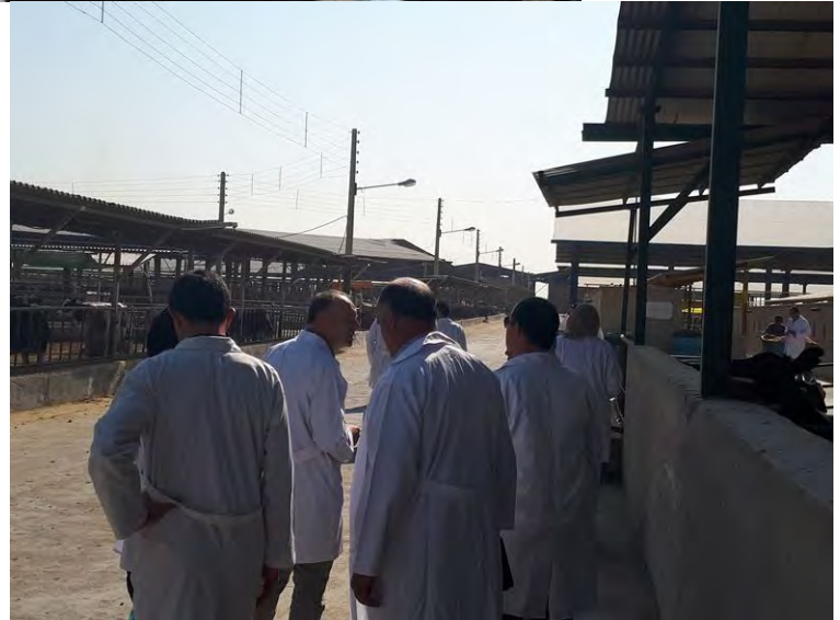
بازدید از مزارع پرورش گاو شیری شرکت فکا، گوساله های اصلاح نژاد مونت بیلارد و جرسی