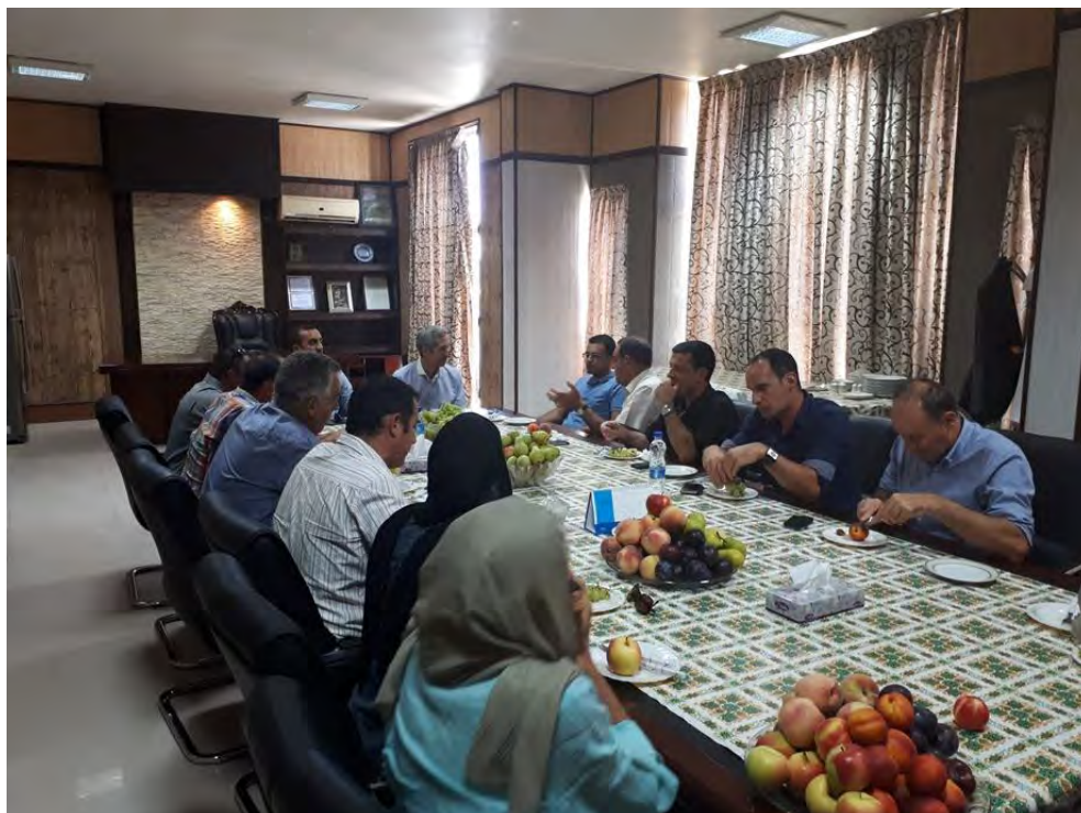
جلسه کارشناسی وضعیت دام گوشتی و شیری در ایران و پتانسیل های کشور در جهت صادرات دام زنده از فرانسه