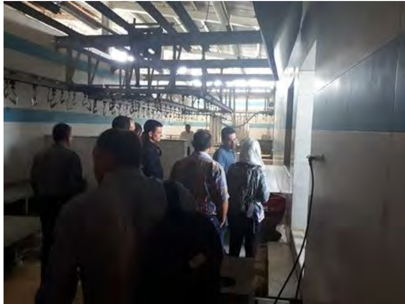
بازدید از تجهیزات کشتارگاه احسان ری