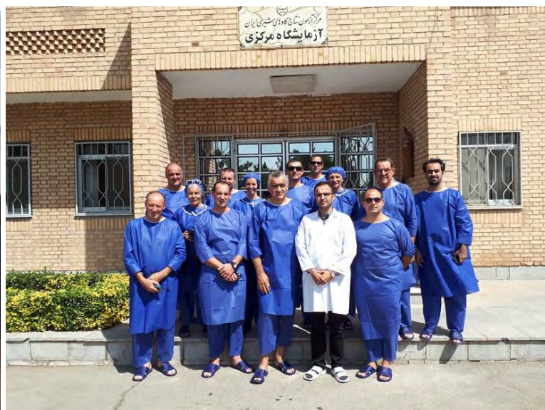
بازدید از مرکز تولید مواد ژنتیکی گاو شیری و گوشتی ایران